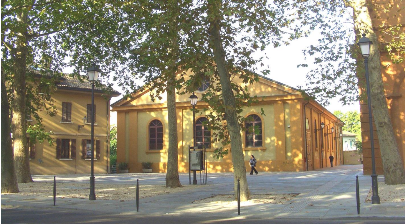
TEATRO CAVALLERIZZA (Centro Cesare Zavattini) Viale Antonio Allegri 8/a, Reggio Emilia - Telefono (Portineria) 0522 458970 – (Centralino) 0522 458811