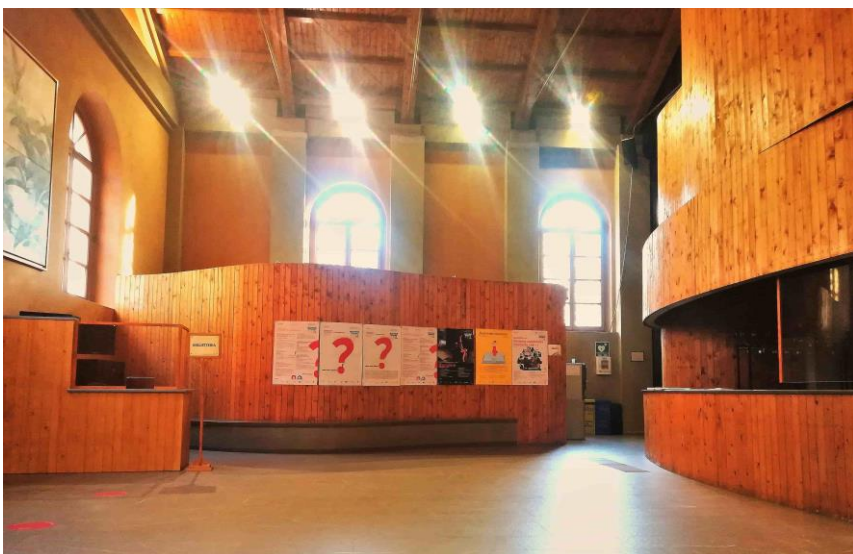
Foyer / guardaroba